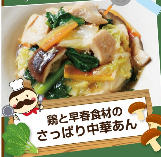
鶏と早春食材のさっぱり中華あん

この時期の野菜は甘くて美味しいため、シンプルな味付けで味わうのがおすすめ。ごはんの上にかけて中華丼にしても。