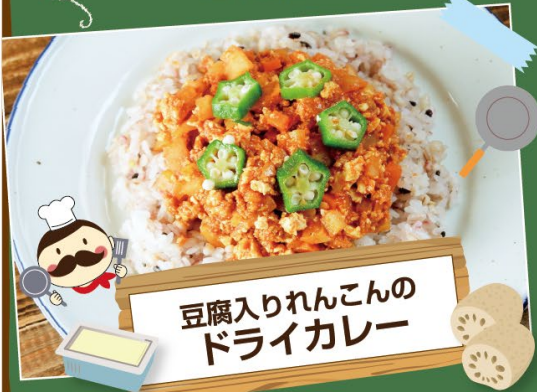
豆腐入りれんこんの ドライカレー

旬のれんこんのシャキシャキ食感と、豆腐のふわふわ食感が楽しい一品。豆腐を入れることで肉の使用量を減らし、根菜で噛みごたえもアップしています。